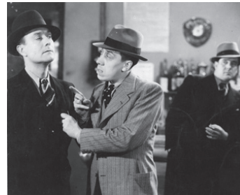
1934 UNE NUIT DE FOLLIES de Maurice Cammage avec Fernandel