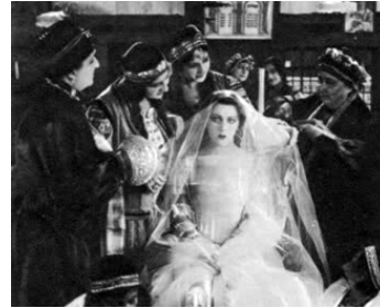
1924 LA TERRE PROMISE d'Henry Roussel avec Raquel Meller