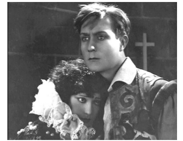
1922 LES OPPRIMÉS d'Henry Roussel avec Raquel Meller