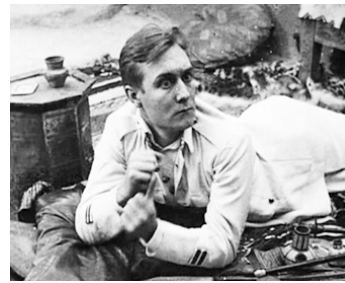
1920 L'ATLANTIDE de Jacques Feyder