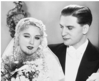
1932 BABY de Carl Lamac & Pierre Billon avec Anny Ondra