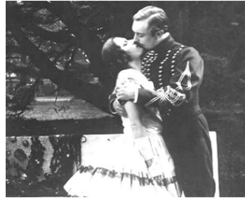
1923 VIOLETTES IMPÉRIALES d'Henry Roussel avec Raquel Meller