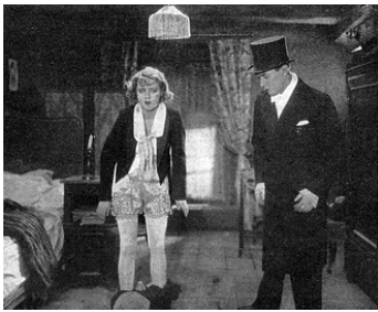
1929 ANNY DE MONTPARNASSE (Sündig und Süß) de Carl Lamac avec Anny Ondra