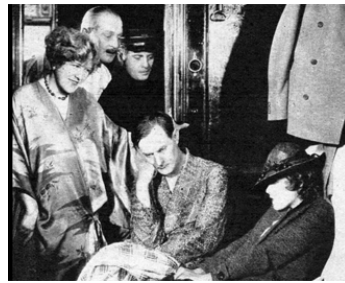
1929 PRINCESSE CAVIAR (Die Kaviarprinzessin) de Carl Lamac avec Anny Ondra