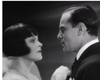
1927 RAPA NUI de Mario Bonnard avec Mona Goya