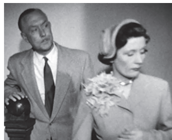
1953 LA FILLE PERDUE de Jean Gourguet avec Gisèle Grandpré