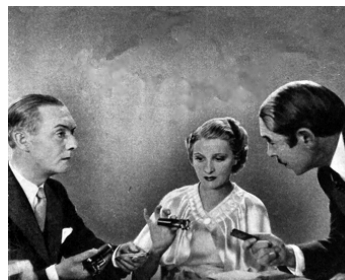
1935 UN SOIR DE BOMBE de Maurice Cammage avec Alice Field, Pierre Larquey