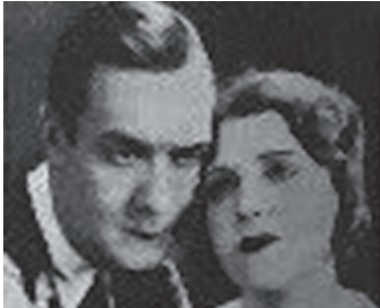
1931 LA CHANSON DES NATIONS de Maurice Gleize avec Dolly Davis