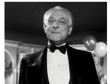
1954 LES PÉPÉES FONT LA LOI de Raoul André