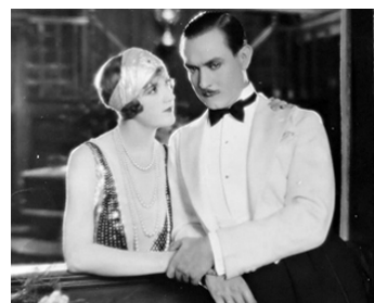
1929 VÉNUS (Venus) de Louis Mercanton avec Constance Talmadge