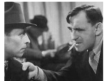
1937 POLICE MONDAINE de Michel Bernheim & Christian Chamborant avec Charles Vanel