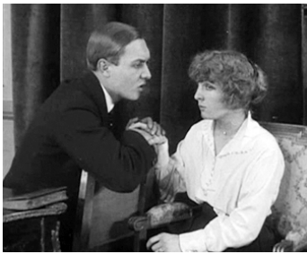
1915 TÊTES DE FEMMES, FEMMES DE TÊTE de Jacques Feyder avec Kitty Holt