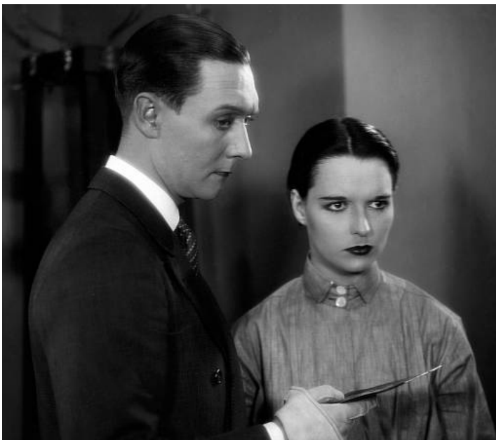
1929 LE JOURNAL D'UNE FILLE PERDUE (Das Tagebuch einer verlorenen) de George Wilhelm Pabst avec Louise Brooks