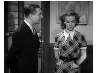
1934 QUELLE DRÔLE DE GOSSE ! de Léo Joannon avec Danielle Darrieux