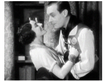
1930 ACCUSÉE LEVEZ-VOUS de Maurice Tourneur avec Gaby Morlay