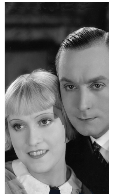
1929 QUAND NOUS ÉTIONS DEUX de Léonce Perret avec Alice Roberts