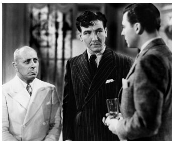
1938 GIBRALTAR de Fédor Ozep avec Erich von Stroheim, Georges Flamant