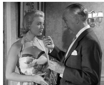
1953 LES CLANDESTINES de Raoul André avec Nicole Courcel