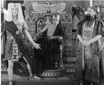
1925 LE BERCEAU DE DIEU de Fred Leroy-Granville avec Joe Hamman