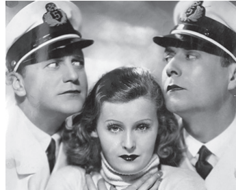
1931 CALAIS-DOUVRES de Jean Boyer avec Harry Liedtke, Lillian Harvey