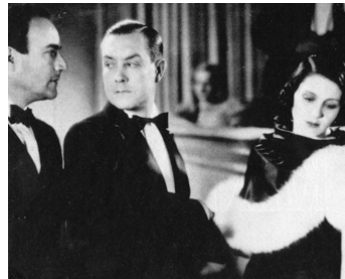
1932 LE TRIANGLE DE FEU d'Edmond T. Gréville & Johannes Guter avec Renée Héribel